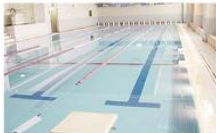
1F POOL (おとな専用)