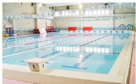
2F POOL (レッスン)