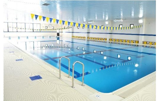
プール外観（スイミング）