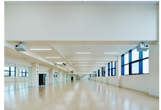
スタジオ外観（体育・ダンスジム）

更衣室にてお着替えします。 一人でお着替えが難しいお子様は、保護者の方もお手伝いください。