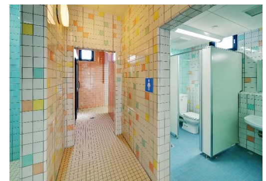
プールサイドトイレ外観

1 日体験はこれで終了です。ご参加ありがとうございました。 ご帰宅の前にフロントにお越しください。 当スクールの会員システムなどのご説明をさせていただきます。