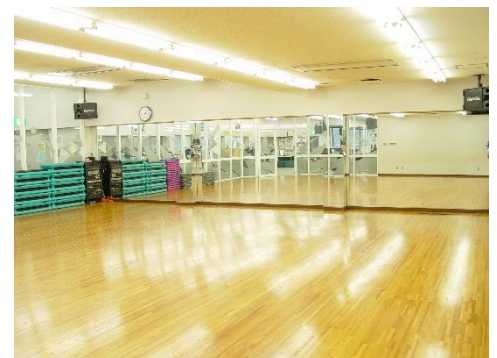
2F スタジオ (体育・ダンスジム)