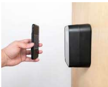
QRコードチェックインのイメージ

スマホをお持ちでない方には、QRコードを発行し既存の会員カードに添付させて頂くことも可能です。 必要な方は、クラブ受付までご用命ください。