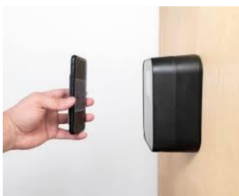
QRコードチェックインのイメージ

スマホをお持ちでない方には、QRコードを発行し既存の会員カードに添付させて頂くことも可能です。 必要な方は、クラブ受付までご用命ください。